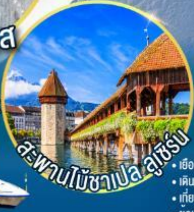
สะพานไม้อาเปลา ลูเซิร์น