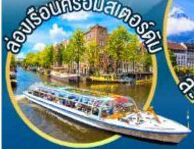
ล่องเรือครอัมสเตอร์ดัม