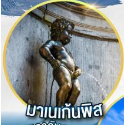
มานกันพิส