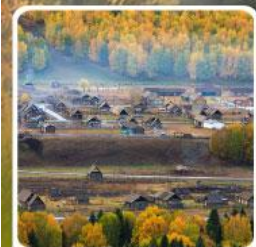
หมู่บ้านเหม่มู

สวรรค์ใบไม้เปลี่ยนสี เยือนคานาสีอแดนฝัน มหัศจรรย์หมู่บ้านเหม่มู เคอเคอทัวให้อัจฉรัยภูผาหิน