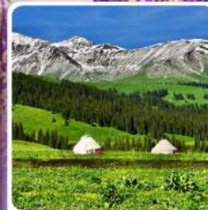
ทุ่งหญ้านาลาตี