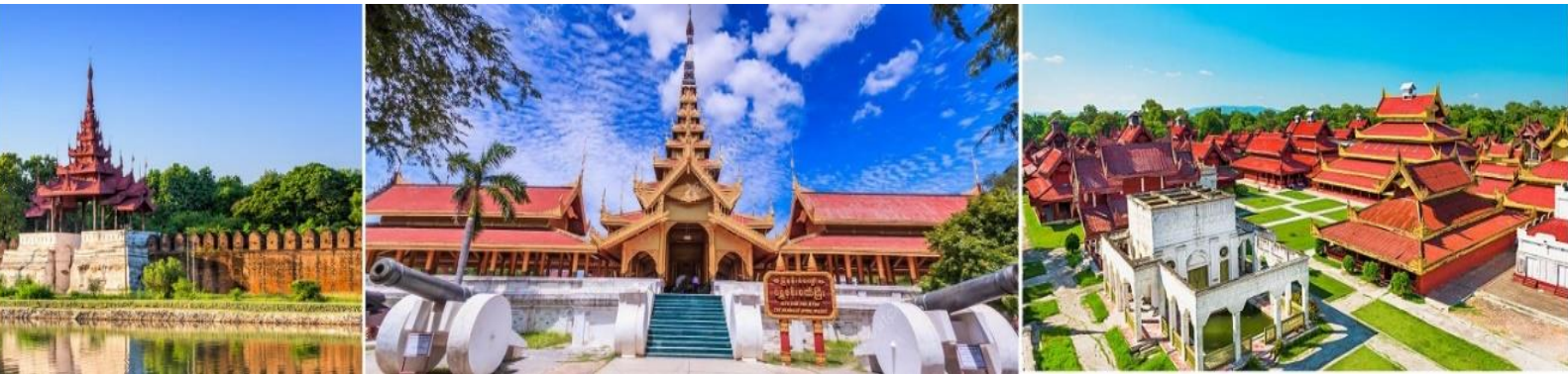
15.00 น. นำท่านชมวิหารชเวนันดอร์ (Shwenandaw Temple) เป็นวิหารที่สร้างด้วยไม้สักทองทั้งหลัง