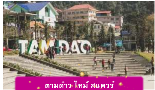
ตามด้าว ไทม์ สแควร์

อิสระท่าน ตลาดกลางคืนตามด้าว เมื่อแสงแดดลับขอบเขา เมืองบนดอยแห่งนี้จะค่อย ๆ เปลี่ยนบรรยากาศเป็นความคึกคักแบบเรียบง่าย ตลาดกลางคืนตามด้าวเต็มไปด้วยของกินพื้นเมือง กลิ่นหอมของหมูย่าง ไชนักรักษา และข้าวโพดย่างลอยคลุ้งไปทั่ว นักท่องเที่ยวเดินจับจ่าย พุดคุย และหยุดถ่ายรูปตามแสงไฟที่ประดับอยู่ทั่วตลาด บรรยากาศเป็นกันเองและอบอุ่น เหมาะกับการเดินเล่น ปิดท้ายวันด้วยความสุขเล็ก ๆ ที่สัมผัสได้