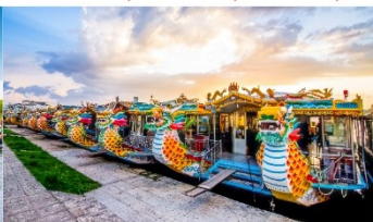
ล่องเรือมังกร