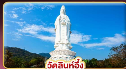
วัดลินทวี่