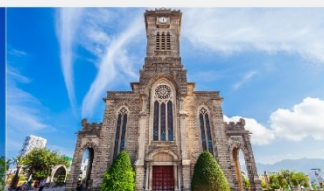
โบสถ์หินญูจาจ