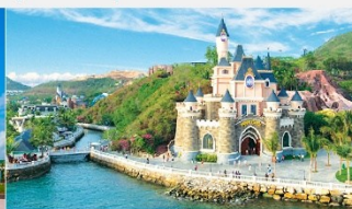
สวนสนุกวันเดอร์ส

*ทางบริษัทฯ ขอสงวนสิทธิ์ในการสลับโปรแกรมทัวร์ตามความเหมาะสมขึ้นอยู่กับสถานการณ์หน้างาน โดยคำนึงถึงผลประโยชน์ของลูกค้าเป็นสำคัญ