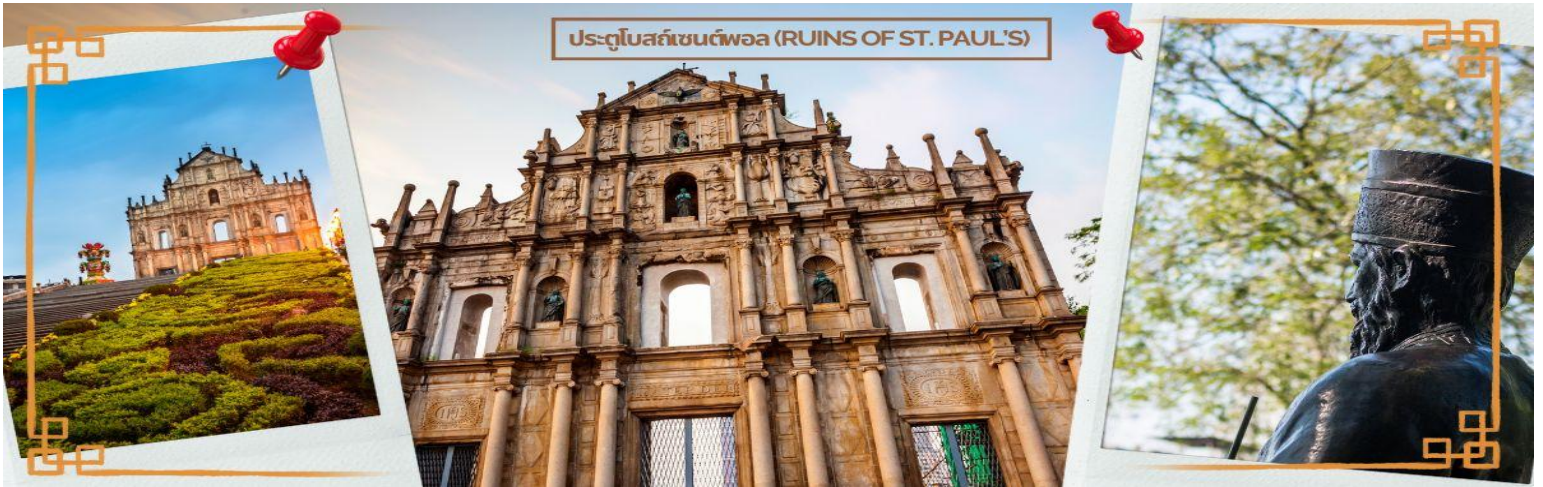
ประตูโบสถ์เซนต์พอล (RUINS OF ST. PAUL'S)

ได้เวลาอันสมควร นำท่านเดินทางสู่ เมืองจูไห่ (ZHUHAI) เป็นเมืองที่มีอาณาบริเวณเขตมหาสมุทรใหญ่ที่สุด มีเกาะมากที่สุด และมีแนวชายฝั่งทางทะเลยาวที่สุดใน ภูมิภาคสามเหลี่ยมปากแม่น้ำ จูเจียง ซึ่งตั้งอยู่ทางริมฝั่งตะวันตก ของปากแม่น้ำจูเจียง หรือแม่น้ำไข่มุกที่ไหลลงสู่ทะเลจีนใต้ใน มณฑลกวางตุ้ง ทางตอนใต้ของประเทศจีน