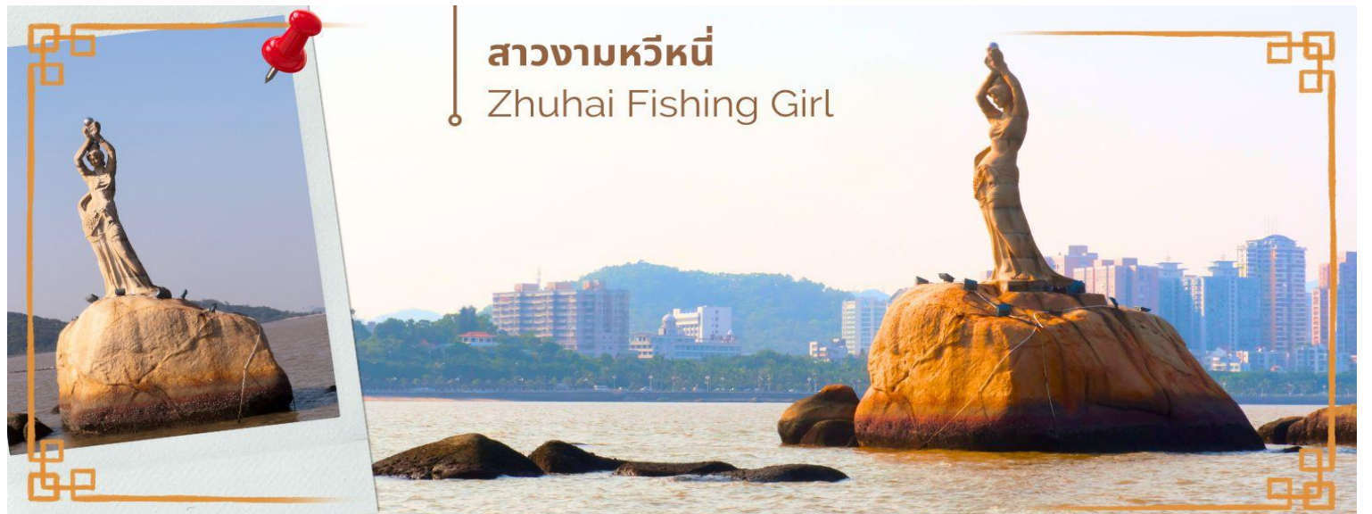
สาวงามหวีหนี่ Zhuhai Fishing Girl

จากนั้นนำท่านแวะซื้อ ยาแก้ร้อนลวก ร้านยา เป่าฟู่หลิง บัวหิมะ ยาประจำบ้านที่มีชื่อเสียง ท่านจะได้ชมการสาธิต การนวดเท้า ซึ่งเป็นอีกวิธีหนึ่งในการผ่อนคลายความเครียด และบำรุงการไหลเวียนของโลหิตด้วยวิถีธรรมชาติ และนำท่าน