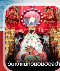
วัดเจ้าแม่กวนอิมฮองฮ่า