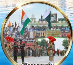
พิธีครองชายแดน อินเดีย-ปากีสถาน ด่านวากาห์