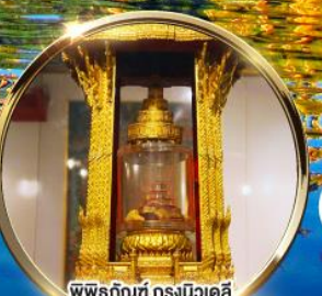
พิพิธภัณฑ์ กรุงนิวเดลี กราบนมัสการพระบรมสารีริกธาตุ