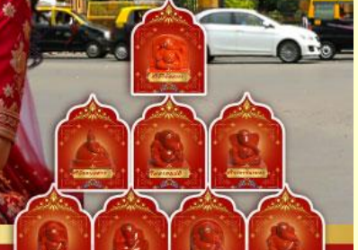
พระพิฆเนศ 8 องค์ เมืองปูणे