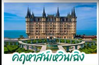
คฤหาสน์หวิ่นเจิง

เมืองเก่าชิงเต่า - คฤหาสน์หวิ่นเจิง เบียร์ชิงเต่า + อาหารทะเล สตรีทอาร์ต สตูดิโอจิบลิ