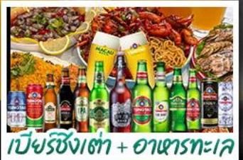
เบียร์ชิงเต่า + อาหารทะเล