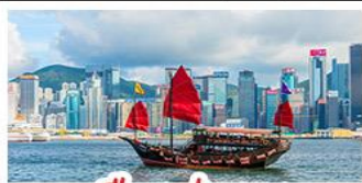
เมืองฮ่อทง

เมืองเก่าชิงเต่า - จิวเมืองฮ่อทง โรงเบียร์ชิงเต่า - ทำเรือชาวประมงเยียนไถ