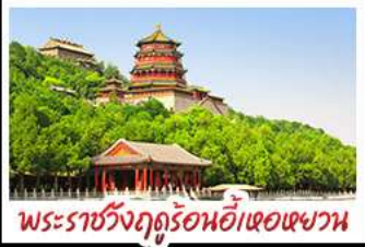
พระราชวังฤดูร้อนอี๋เหอหยวน

ท่าอากาศยานจีนด่านจวิ๊ยงกวน - พระราชวังฤดูร้อนอี๋เหอหยวน สวนจิ่งอัน - วัดลามะ - โมลงร้านซ้อป - โรงแรม 4 ดาว บ๊อพิศษ เป็ดปักกิ่ง สุกี้มองโก MICHELIN GUIDE ร้าน TAO TAO JU