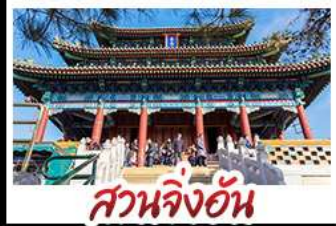
สวนจิ่งอัน