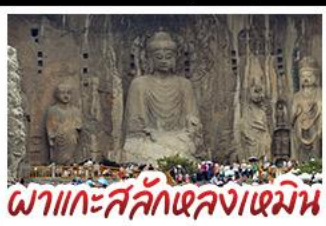
ภาพแกะสลักเฉกหลงเหมิน

เที่ยวครบ 4 มรดกโลก ถ้ำหลงเหมิน - สุสานจีนซีอองเต้ - วัดเส้าหลิน หมู่บ้านไต้ดินसानโจว - หมู่บ้านกัวเลียงซุน