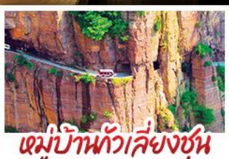
หมู่บ้านกัวเลียงซุน