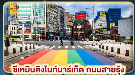
ซีเหมินติงไนท์มาร์เก็ต ถนนสายรุ่ง