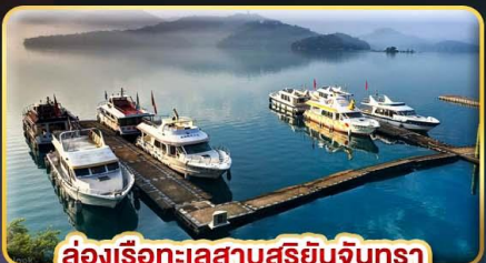
ล่องเรือทะเลสาบสุริยจันทราร