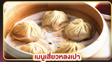
เมนูเสี่ยวหลงเปา