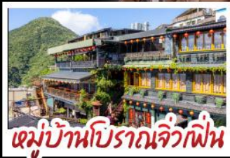
หมู่บ้านปิศาจจิ้งจอกไฟ