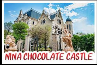
NINA CHOCOLATE CASTLE