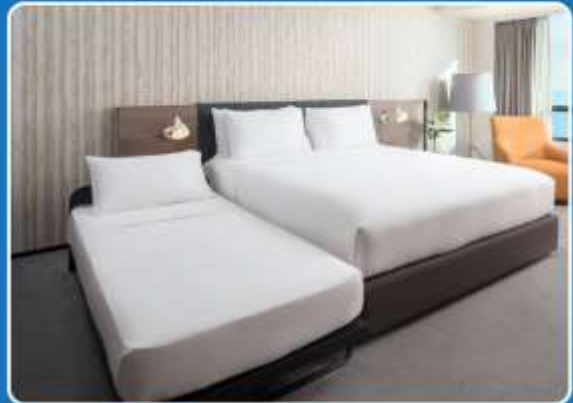
👤👤+👤 TRIPLE (TRP)

**รูปภาพห้องพักเป็นเพียงภาพสื่อถึงประเภทของเตียงเท่านั้น ไม่ใช่ภาพห้องพักจริงสำหรับการเข้าพัก**