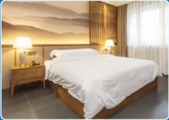
👤 SINGLE (SGL)