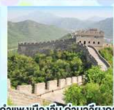
กำแพงเมืองจีน ด้านจวิ๊ยกวอน