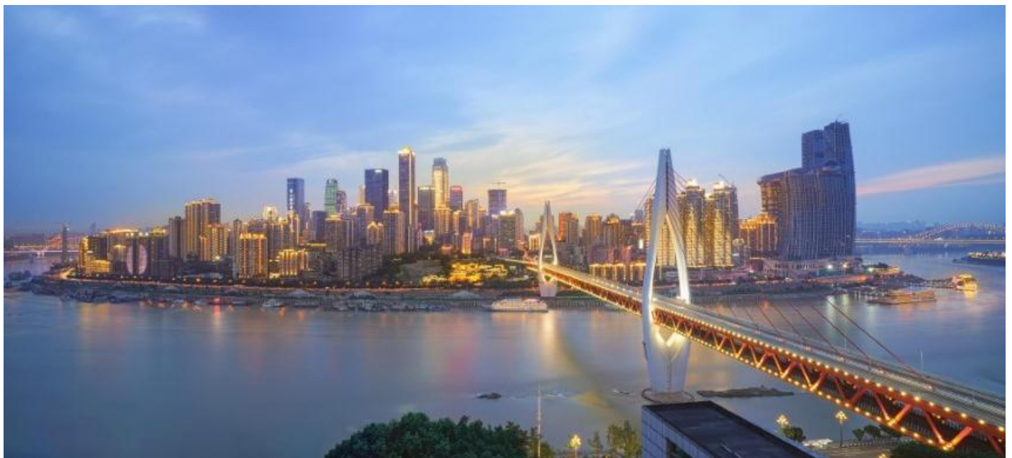
ที่พัก VIENNA HOTEL CHONGQING AIRPORT หรือเทียบเท่าระดับ 4 ดาว (มาตรฐานประเทศจีน)

วันที่สอง ต้าจู่ - พุทธศิลป์ผาแกะสลักต้าจู่ - ฉงชิ่ง - ถนนคนเดินเจียงฟางเป่ย์ - จัตุรัสราฟเฟิลส์