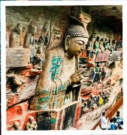
ฉาหิ้นเกะสลักต้าจู้