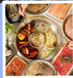
หม้อไฟหมาล่า