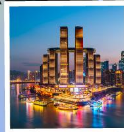
ตึกรูปฟีล