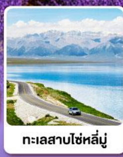
ทะเลสาบไซห์หลินู๋