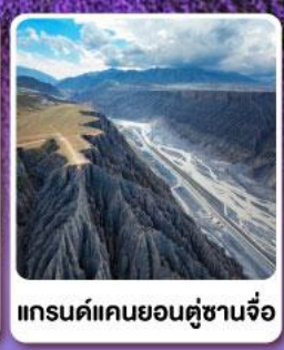
แกรนด์แคนยอนคูซันจื่อ