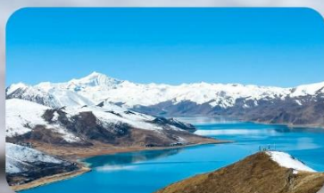
ทะเลสาบยัมดรอก