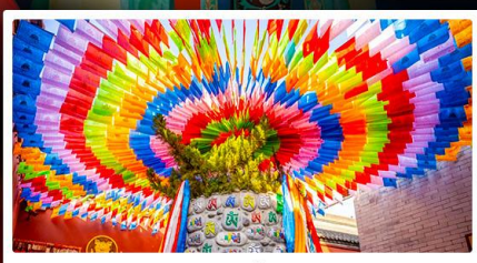
วัดลามะกว้างหฺริน