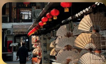
ถนนโบราณซูหยวนเหมิน