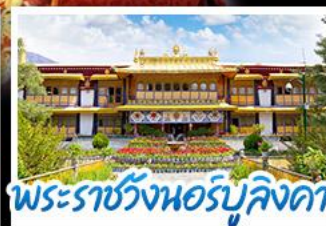
พระราชวังนอร์บูลิงคา