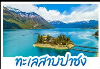
ทะเลสาบปาซง

รถไฟสายหลังคาโลก พระราชวังโปตาลา วัดโจคัง - ทะเลสาบปาซง พระราชวังฤดูร้อนนอร์บูลิงคา