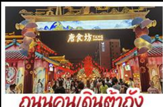
ถนนคนเดินต้าถิง