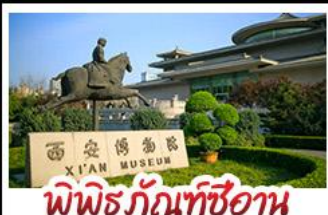
พิพิธภัณฑ์ซีอาน