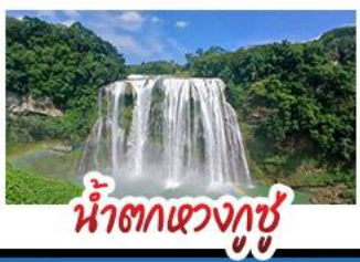
น้ำตกหวงกู่ชู่

สะพานหุบเขาชาวจiang สะพานแขวนที่ยาวที่สุดในโลก ปราสาทหลงเปา - หมู่บ้านแม้วอูเจียงจ้าย กุ้ยหยางชมทุ่งดอกไม้สตาร์ดและดอกซากุระ ล่องเรือทะเลสาบห้วนเฟิงหู - น้ำตกหวงกู่ชู่ พักโรงแรมระดับ 4 ดาว - ชมหอคอยฉิวไหลว เมนูปลาต้มซุบเปี๋ยว - ไม่ลงร้านเช็บบ