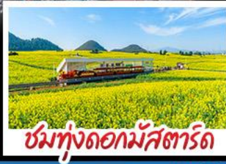
ชมทุ่งดอกไม้สตาร์ด