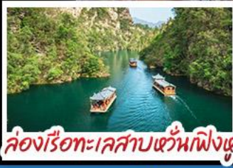
ล่องเรือทะเลสาบห้วนเฟิงหู