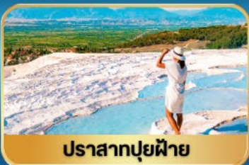
ปราสาทฟูฟ้าย