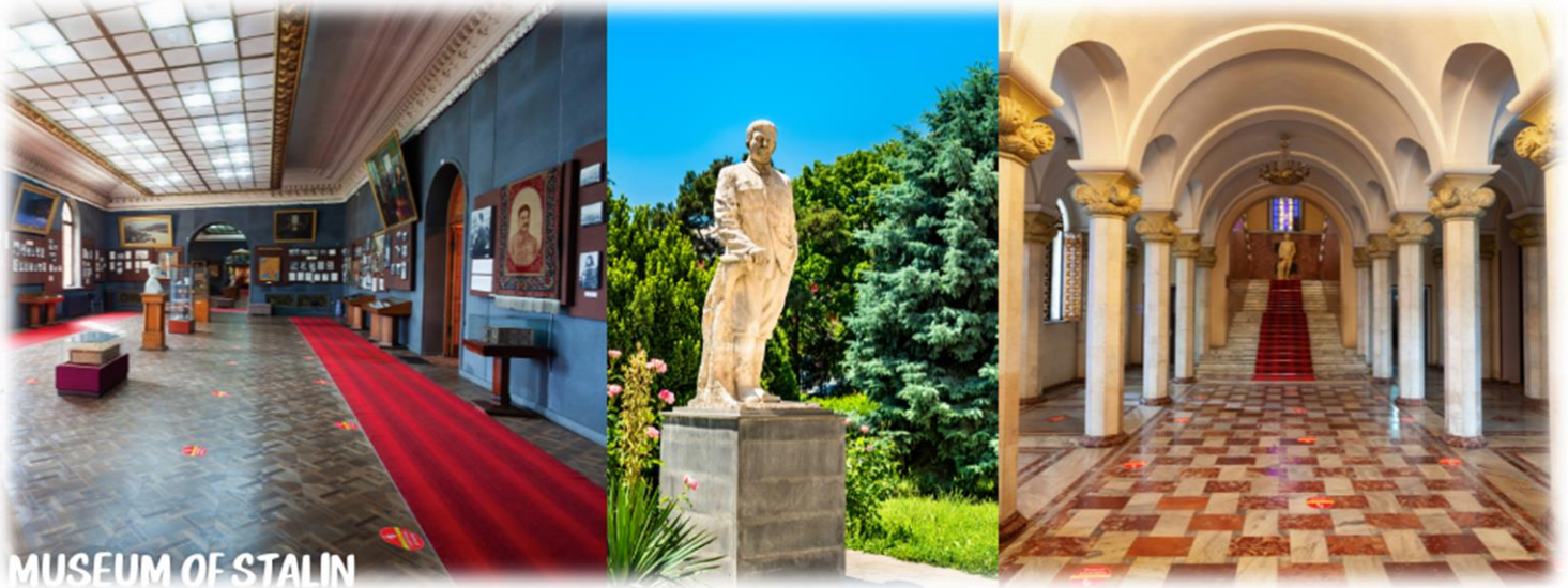
MUSEUM OF STALIN

นำท่านออกเดินทางสู่ เมืองกอรี (GORI) ทุกวันนี้ เป็นเมืองแห่งประวัติศาสตร์ เป็นที่รู้จักกันดีว่าเป็นบ้านเกิดของ “โจเซฟ สตาลิน” (Joseph Stalin) ชาวจอร์เจียที่ในอดีตเป็นผู้ปกครองสหภาพโซเวียต ในยุคศตวรรษที่ 1920 ถึง 1950 และมีชื่อเสียง เรื่องความโหดเหี้ยมในการปกครองในเมืองกอรีแห่งนี้