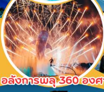
อลังการพลุ 360 องศา