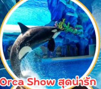
Orca Show สุดน่ารัก