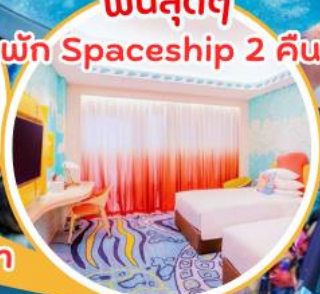
ฟินสุดๆ พัก Spaceship 2 คืน!!