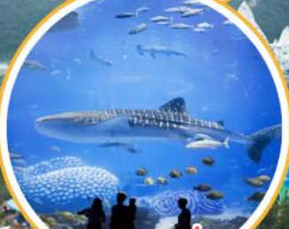
อควาเรียมใหญ่ที่สุดในโลก