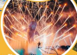
อลังการพลุ 360 องศา