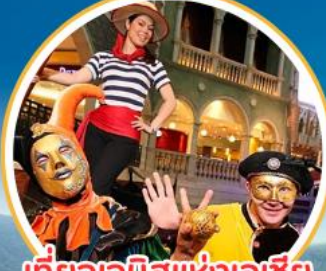
เที่ยวเอเชียแห่งเอเชีย