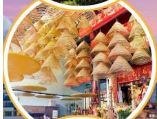
ไหว้พระวัดดั่ง