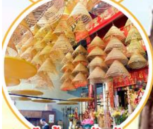
ไอ้หั่วพระวัดดัง