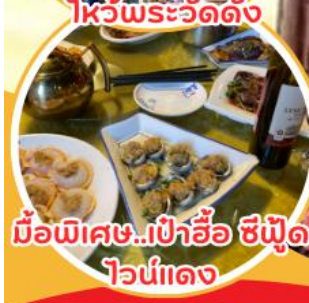
มือพิเศษ...เป่าฮ้อ ซีฟูด ไวน์แดง