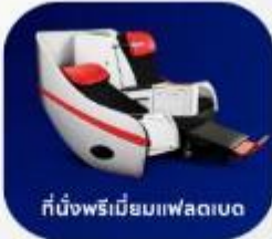
ที่นั่งพรีเมียมฟเลกซ์