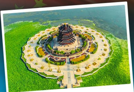
วัดดงหยวน

ล่องเรือชมป่าในน้ำทะเลสาบซิงชาน ไหว้พระใหญ่หลิงซาน เทียบมหานครเซี่ยงไฮ้