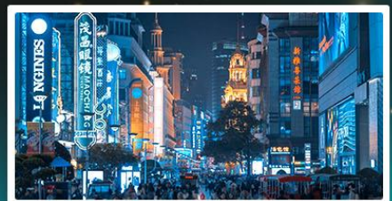
ป่าเปลี่ยนสีทะเลสาบซิงชาน