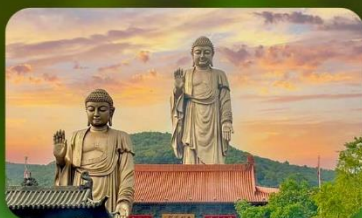
พระใหญ่หลิงชาน