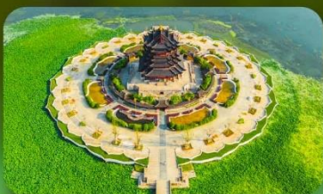
วัดฉงหยวน