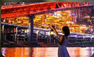
สวนริมแม่น้ำแกรนด์เธียร์เตอร์