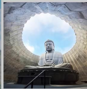
"HILL OF BUDDHA"