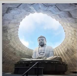
“HILL OF BUDDHA”