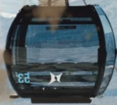
NISEKO ACE GONDOLA