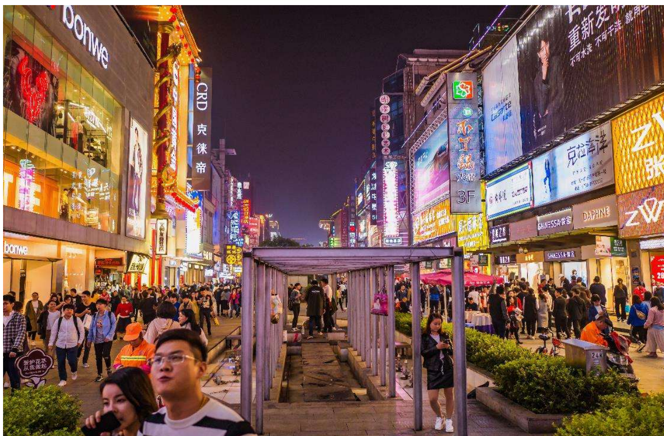
T2G-CSX16SL ZhangJiajie...ฉางซา จางเจียเจีย ฟู่หลงเจิ้น เฟิ่งหวง สะพานแก้ว 6D 5N (SL)