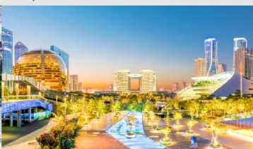
จุดชมวิว City Balcony