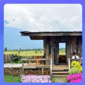
ร้านกาแฟหยุนตัน