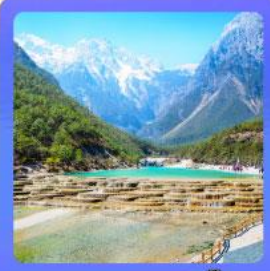
หุบเขาพระจันทรสีน้ำเงิน