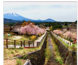
ซากุระอียาชิโนะซาโตะ

THAI สายการบินไทย บริการทุกระดับประทับใจ FULL SERVICE