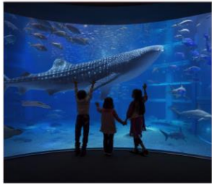
พิพิธภัณฑ์สัตว์น้ำไคยุดัง