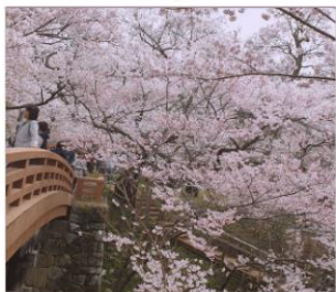
ซากุระปราสาททาคาโตะ