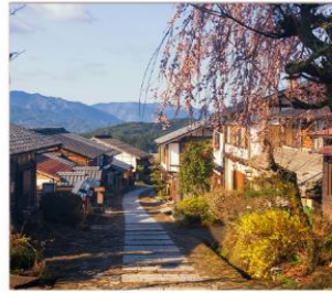
มาโกเมะจุกุ