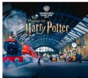
แฮร์รี่ พอตเตอร์ สตูดิโอโตเกียว