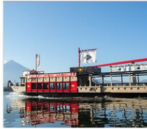
ล่องเรือซามูไรอาปาเระ