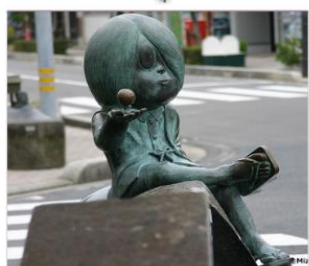
ตามรอยอนุสาวรีย์เด็กสาว