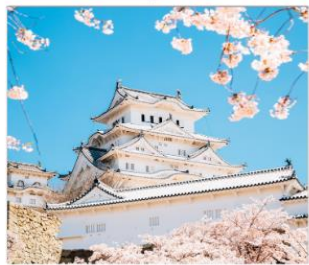
ชมซากุระรอบ ปราสาทฮิเมจิ