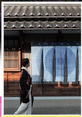
เมืองเก่าคัทสึยะมะ