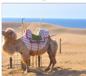
เนินทราย ทตโตริ