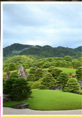
พิพิธภัณฑ์ศิลปะอะดะจิ