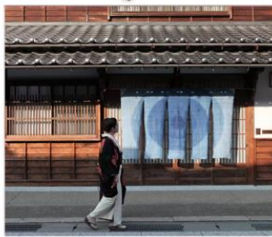
ย่านเมืองเก่าดัทสึยะมะ