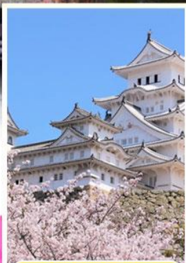
ปราสาทฮิเมจิ