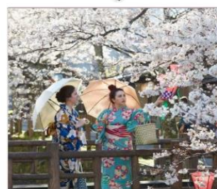
แต่งชุดยูกะตะชมซากุระย่าน เมืองออนเซนคิโนซากิ