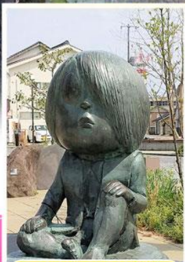
ออนเซนน้อยคิทาโร่