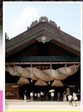
ศาลเจ้าอิซุโมะโทเซะ

♨️ ออนเซน 3 คั้น 🧳 นน.กระเป๋า 23X2 กก. ☀️ 7Days 4Night