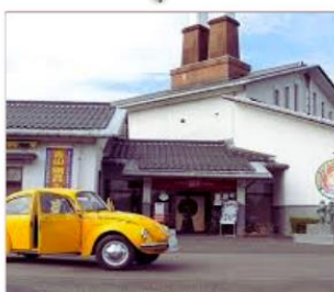
พิพิธภัณฑ์โดนมัน ทตโตริ