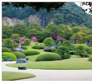
พิพิธภัณฑ์ศิลปะอะดะจิ สวนสวยอันดับ 1