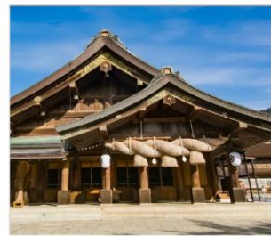
ศาลเจ้าอิซุโมะโทยะ