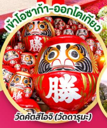
วัดคัตสึโอจิ (วัดดามมะ)