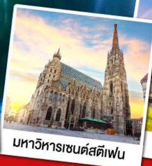
มหาวิหารเซนต์สตีเฟ่น