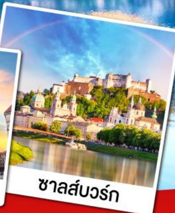
ชาลส์บวร์ก

เที่ยวหมู่บ้านอัลสติกที่สวยงามที่สุดในโลก เข้าชมความงดงามภายในของปราสาทนอยชวานสไตน์