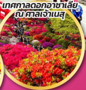
เทศกาลดอกอาซาเลีย ณ ศาลเจ้าเนสุ