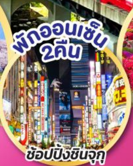
พักออนเซ็น 2 คืน