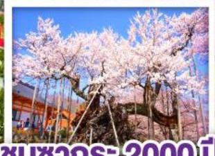
ชมซากุระ 2000 ปี เมืองโฮคุโต