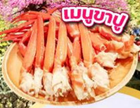
เมนูชาบู