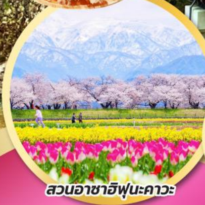
สวนอาซาฮีฟุเนะคาวะ