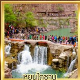
หยุนโกซาน