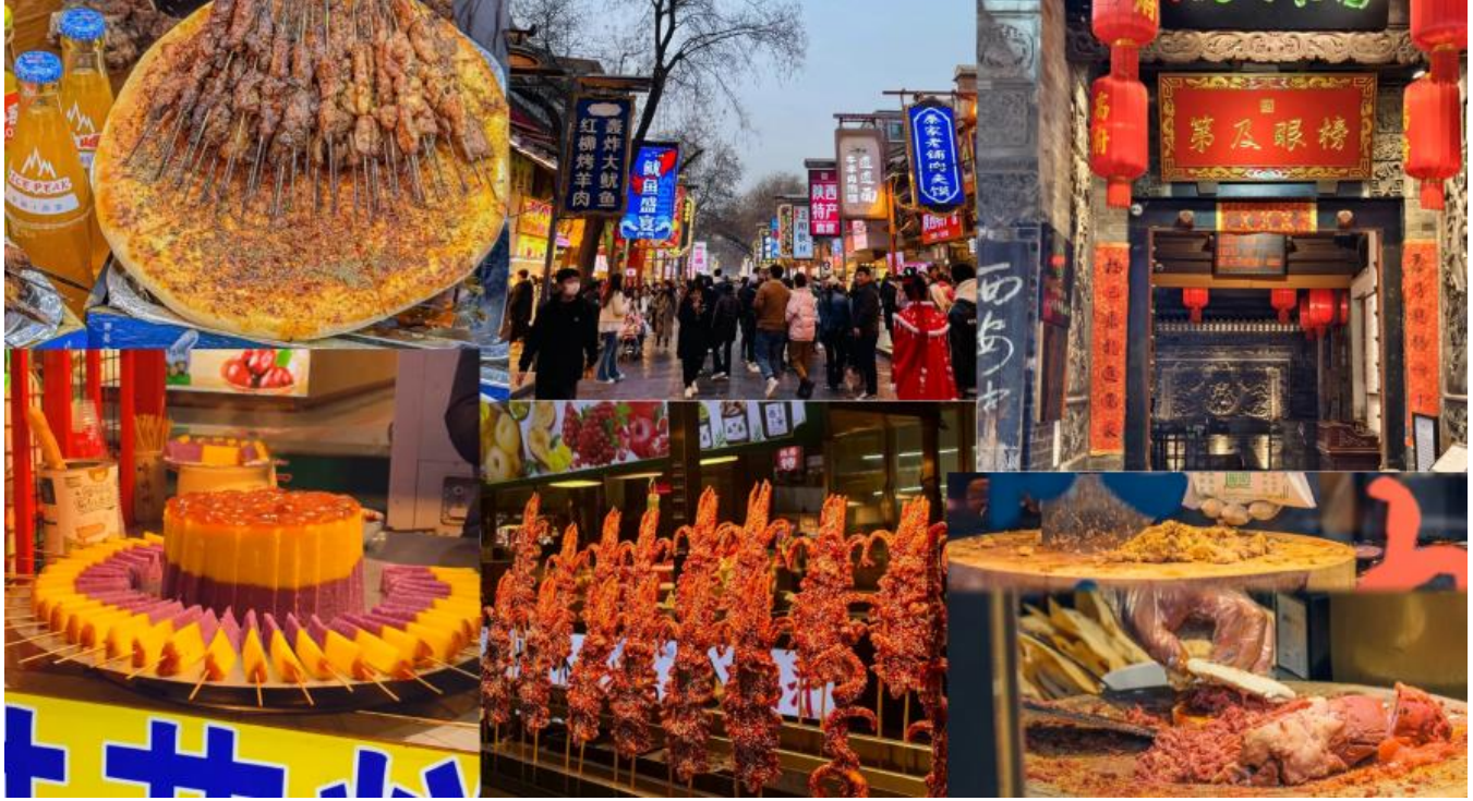
กลางวัน รับประทานอาหารกลางวัน ณ ภัตตาคาร (มื้อที่ 2)

ควีนฟุ้งไม่หยุด ขนมพื้นบ้านที่ผสมสูตรโบราณกับวิถีชีวิตของผู้คนที่นี่ นอกจากความอร่อย ยังมีมัสยิดเก่าแก่หลายแห่งที่ซ่อนอยู่ในตรอกซอย ที่เปรียบดั่งหัวใจของศรัทธา และ การอยู่ร่วมกันของวัฒนธรรมจีนและมุสลิมอย่างสงบมาเนิ่นนาน