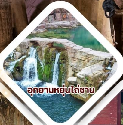
อุทยานหยุนไถ่ซาน