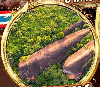
หินสามวาฬ