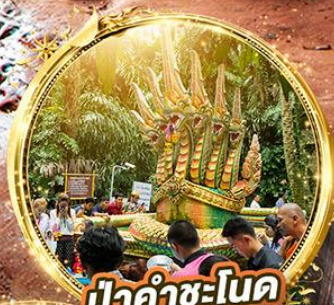
ป่าคำชะโนด