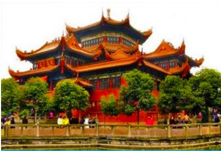
วัดเจเจีย