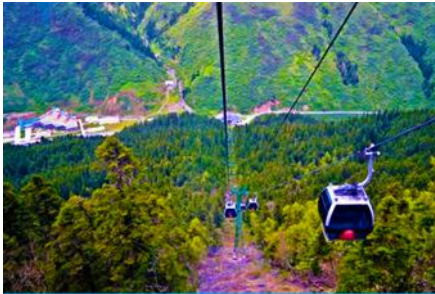
นั่งกระเช้าขึ้นสู่อุทยานหวงหลง

พักที่ JIUYUAN HOTEL ระดับ 4 ดาวท้องถิ่นหรือเทียบเท่าในอุทยานจิวจ้ายโกว