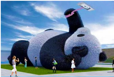
ตุ๊กตาแพนด้าอนเซลฟี

พักที่ MAOXIAN INTER HOTEL โรงแรมระดับ 4 ดาวหรือเทียบเท่าในเมืองเม่าเจี้ยน