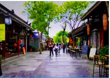
ชอยกวาง ชอยแคบ และชอยบ่อน้ำ

วันที่หก เมืองเฉิงตู-วัดเจเจีย- ถนนโบราณจิ้นหลี่-ชอยกวางชอยแคบ-SPK Global Center-ชมแสงสีบนตึกแฝด – เดินทางกลับกรุงเทพฯ