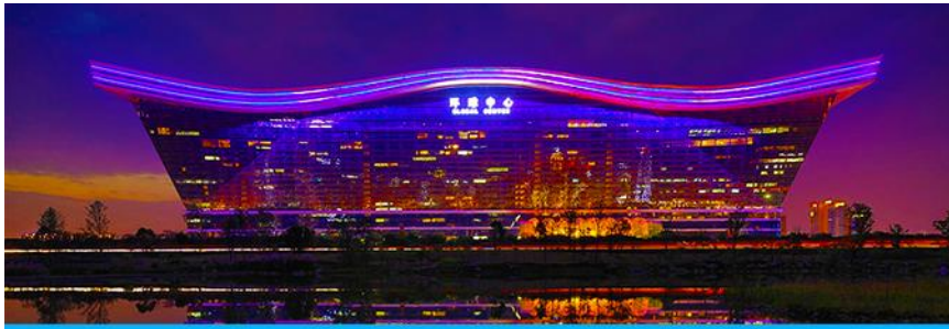
Chengdu new century global center