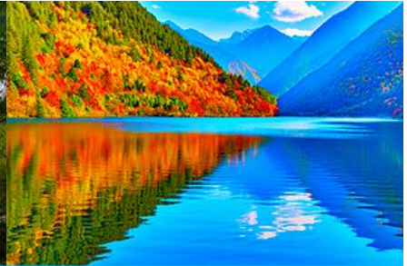
ทะเลสาบแพนด้า

วันที่สาม อุทยานจิวจ้ายโกว(รถเมล์ในอุทยาน)-ทะเลสาบทะเลยาว-ทะเลสาบห้าสี-น้ำตกธารไข่มุก-ทะเลสาบนกยูง- ทะเลสาบแพนด้า