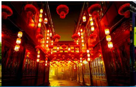
ถนนโบราณสถานจิ้นหลี่