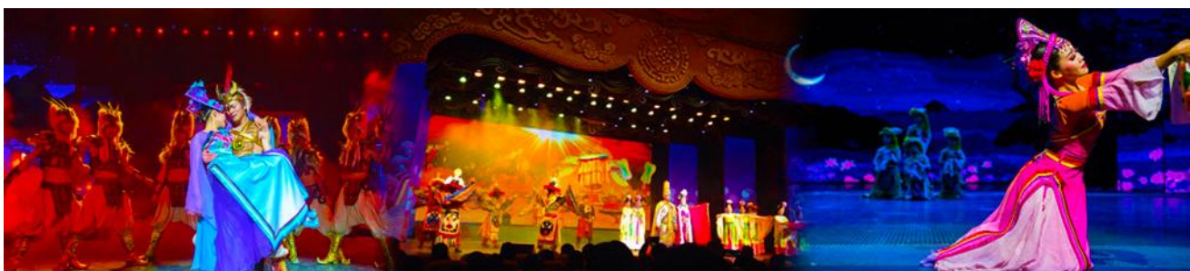
Romantic Show of Jiuzhai

หมายเหตุ : การท่องเที่ยวภายในอุทยานนั้นไกด์และหัวหน้าทัวร์ จะใช้วีจาร์ณญาณในการนำท่านเดินทางท่องเที่ยวตามจุดชมวิวดังต่างๆ ภายในอุทยาน ซึ่งจะพยายามไปเที่ยวให้ได้มากที่สุดเท่าที่สามารถทำได้ ทั้งนี้ขึ้นอยู่กับการใช้เวลาในแต่ละสถานที่ และความร่วมมือในการ รักษาเวลาของคณะทัวร์ และสภาพอากาศในวันนั้นๆ ณ วันเดินทาง หากคณะไม่สามารถเดินทางไปชมอุทยานจิวจ้ายโกวได้ ไม่ว่าจะเนื่องจากสภาพอากาศ หรือเหตุผลใดๆ ทางบริษัทฯ ขอสงวนสิทธิ์ในการเปลี่ยนสถานที่ท่องเที่ยวเป็น“อุทยานแห่งชาติซิงผิงโกว” และ/หรือสถานที่เที่ยวอื่นแทน