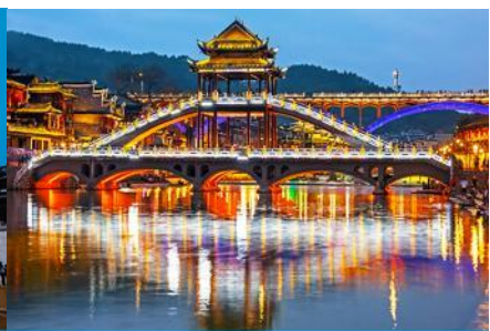
สะพานหวงเจียว

วันที่ดี เที่ยวชมเมืองโบราณผู่หรงเจิ้น-เดินทางสู่เมืองโบราณฟ่งหวง- เที่ยวชมย่านเมืองเก่าเมืองโบราณฟ่งหวง