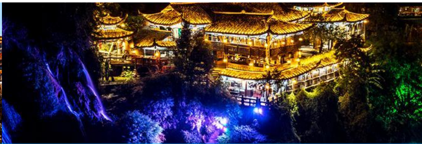
เมืองโบราณฝูหลงเจิ้น

วันที่สาม เมืองหยี่ซัง – เมืองจางเจียเจี๋ย – ตึกมหัศจรรย์ 72 ชั้น-ศูนย์แพทย์แผนจีน – เมืองโบราณฝูหลงเจิ้น