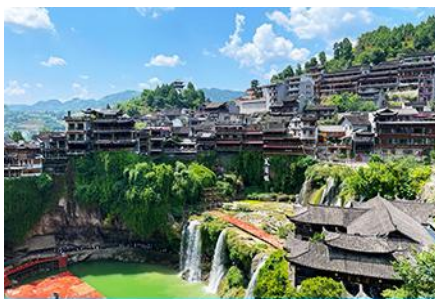
เมืองโบราณผู่หรงเจิ้น

https://hk.trip.com/hotels/guzhang-hotel-detail-68614854/chaxitai-holiday-hotel/