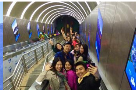
บันไดเลื่อนทะเลภูเขา

วันที่ห้า เมืองโบราณฟงหวง-เมืองจางเจียเจีย-ศูนย์ผลิตภัณฑฺ์ยางพารา- กระเช้าขึ้นเขาเทียนเหมินซาน ระเบียบง แกว่เลียบนหน้าผา – บันไดเลื่อนทะเลภูเขา – (เลือกซื้อโปรแกรมเสริม โข่ว / จิ้งจอกขาว หรือ เมย์ลี่เซียงซี)