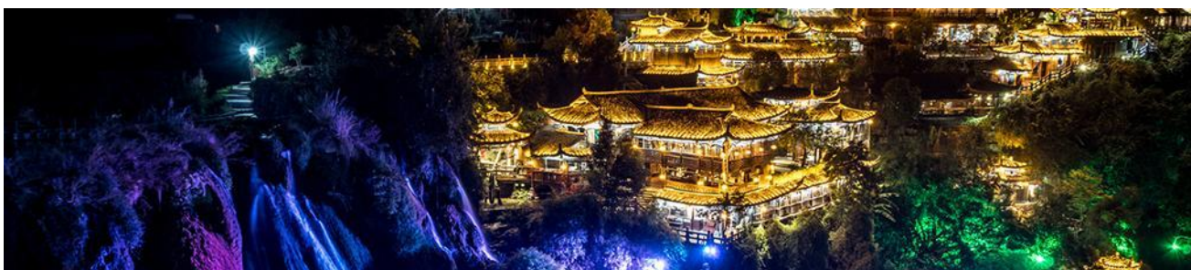
เมืองโบราณ ฝูหลงเจิ้น