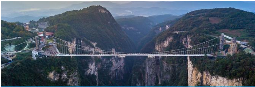
สะพานกระจกจางเจียเจีย

พักที่ GUIYUANZHENPIN HOTEL โรงแรมระดับ 4 ดาวหรือเทียบเท่า