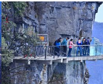
หน้าพลาวยฟ้าก้าวเดินกระจาก