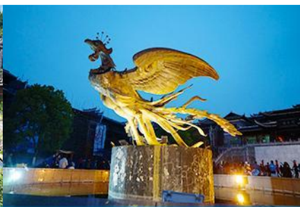
เมืองโบราณฟ่งหวง