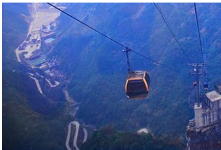
กระเช้าขึ้นเขายเทียนเหมินซาน

โรงแรมระดับ 4 ดาวท้องถิ่นหรือเทียบเท่าในเมืองฟงหวง