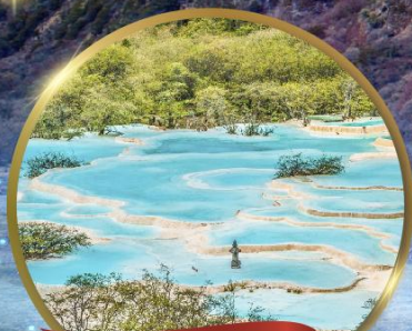
อุทยานหวงหลง