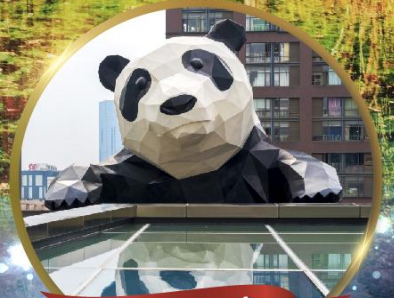
แพนด้ายักษ์

มหัศจรรย์ความงาม อุทยานจิวจ้ายโกว (รวมรถเหมาเที่ยวอุทยานเต็มวัน) ชมอุทยานหวงหลง (รวมกระเช้า) • สีดรุณี • อุทยานซองเจียวโกว (รวมรถอุทยาน) เมืองเก่าชงพาน • ถนนคนเดินจินหลี่ + ไถ่กูหลี่ • ชมแพนด้ายักษ์ป็นตึก