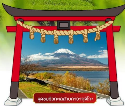
จุดชมวิวกทะเลสาบคาวากุจิโกะ